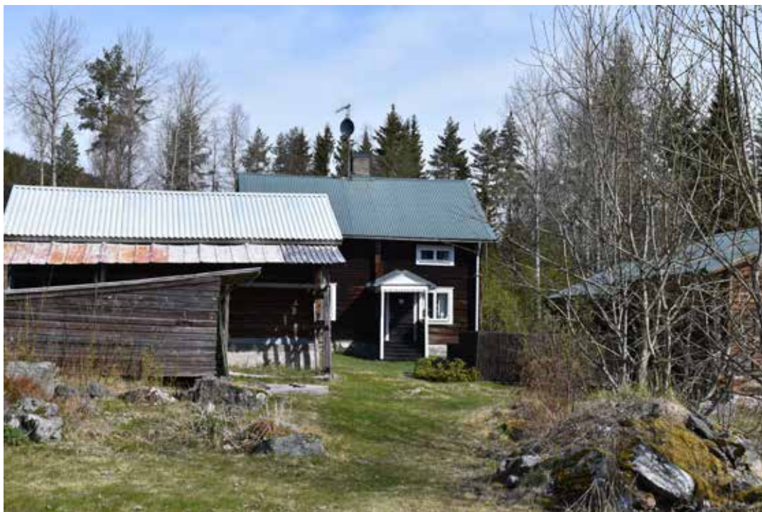
En större enkelstuga med tillhörande kringbyggt gårdstun. Kilen 1:34.