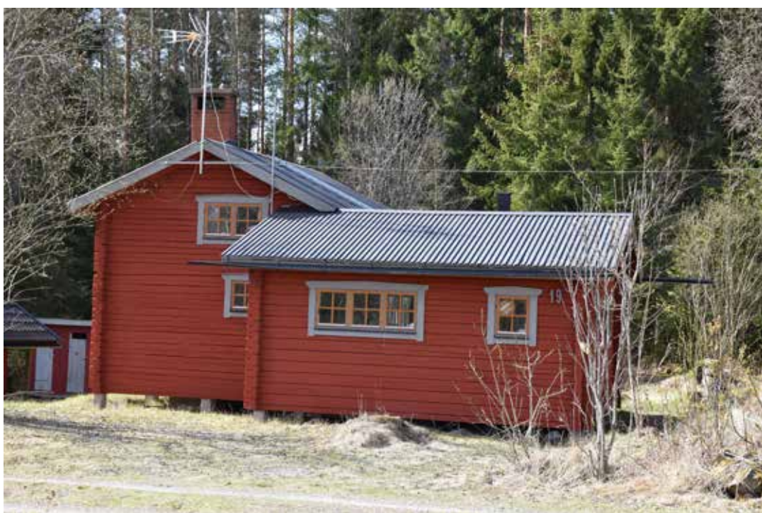
Nybyggd eller renoverad stuga med bergslagsgrå foder och spröjsar i guldockra. Kilen I:23.