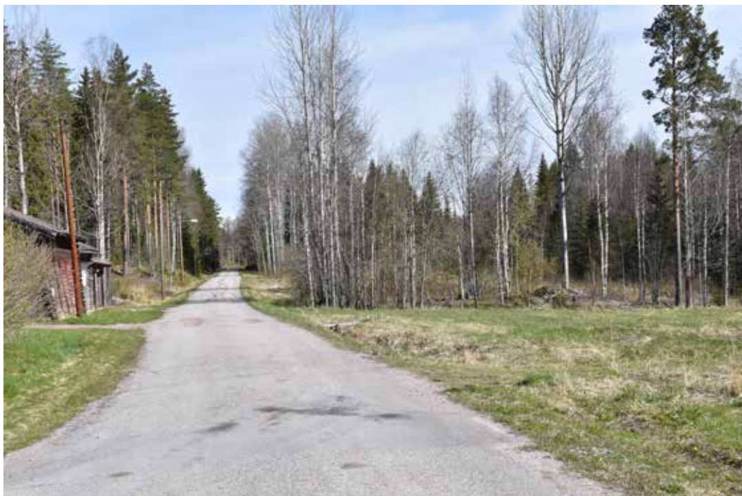
Den långa bilvägen löper från Sågmyravägen i söder och vidare förbi Risholn i norr. Stora delar av sträckan är dragen på den gamla banvallen till järnvägen Falun–Rättvik.