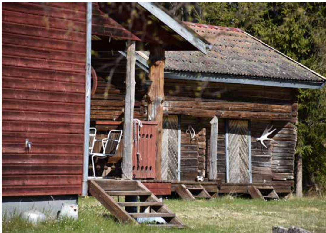
Kringbyggd gård med sidokammarstuga och flera ålderdomliga ekonomibyggnader. Kilen 7:12.