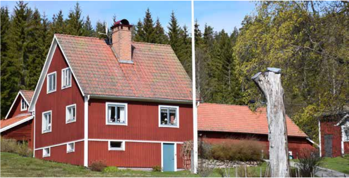
En modernare villa utgör bostadshus på den annars gamla jordbruksgården Hissvåla 6:8.

nader har dessutom en långsmal form eller bildar tillsammans långsmala längor som ingår i olika kringbyggda former. De flesta byggnaderna har också sadeltak med tegeltäckning. Att de flesta husen är färgade med falu rödfärg eller omålade i trä är också mycket viktigt för byarnas generella karaktär. Den faluröda färgen har dessutom historisk betydelse, då den präglar byarna i Övre Dalarna och Leksand sedan åtminstone 1800-talets senare hälft. Beträffande vita detaljer i form av exempelvis fönster, fönsterfoder, vindskivor och knutbrädor är detta värdefullt där det förekommer, eftersom även detta är en påtaglig beståndsdel i byns karaktär.