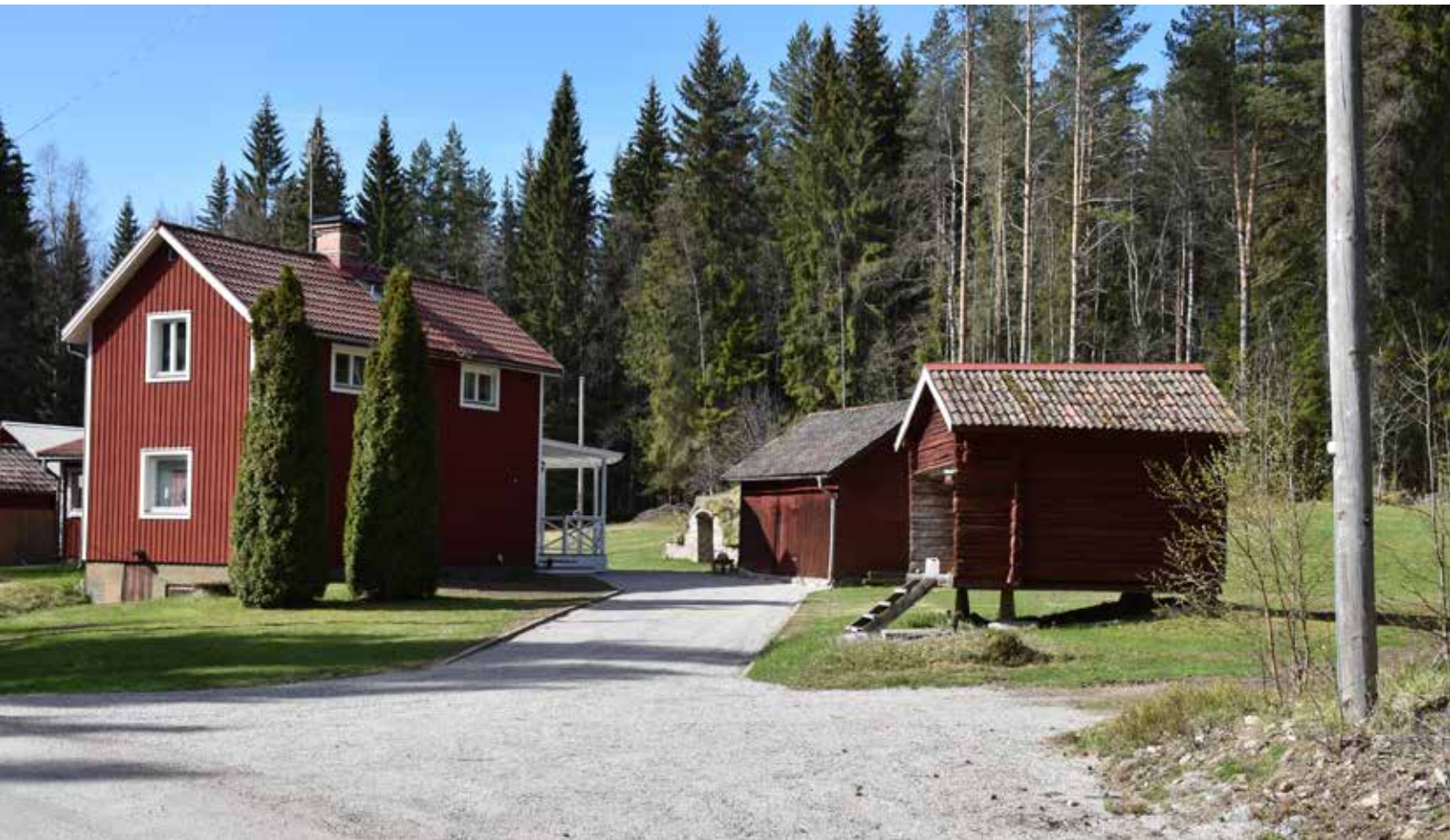
Äldre gård med tilläggsisolerat bostadshus intill bilvägen. Gården har flera varsamt bevarade ekonomibygnader. Hälla 15:8.