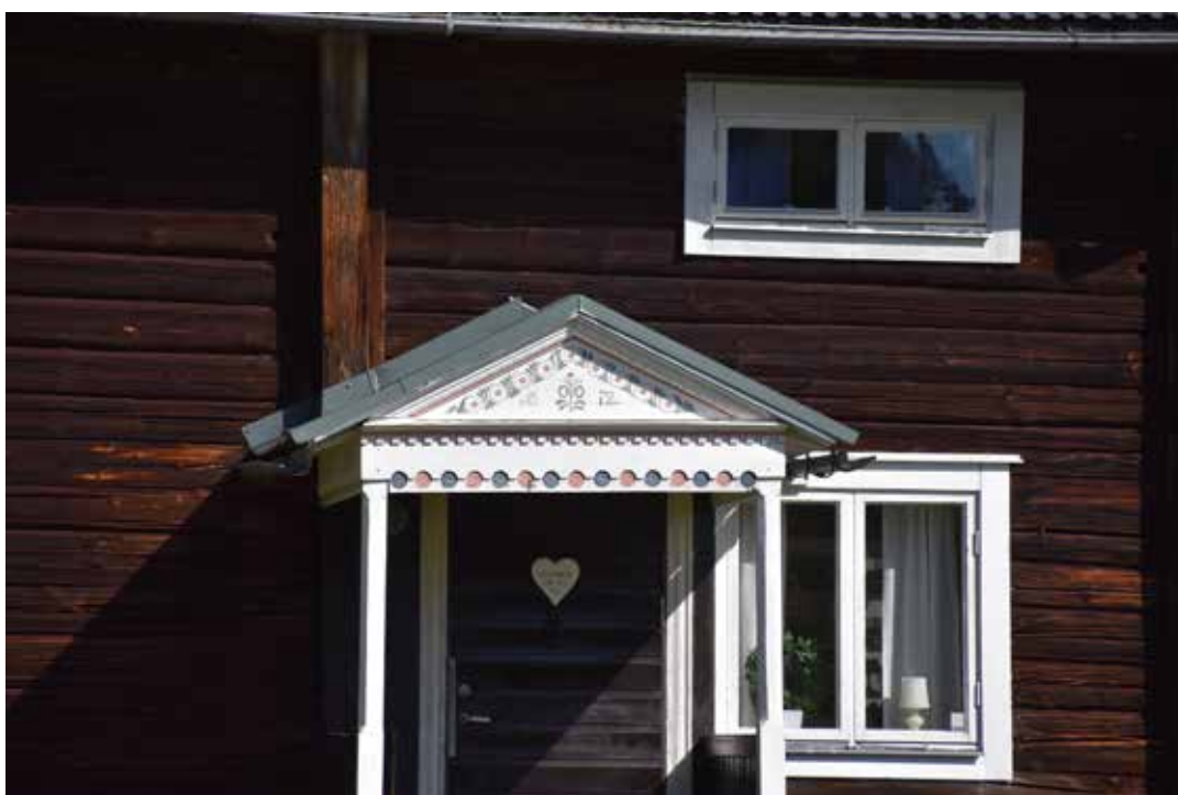
Närbild på farstukvist med tandsnitt och måleri i gavelfältet. Måleriet bär årtalet 1872. Tvåluftsönstren har tillkommit vid fönsterbyte, troligen under 1900-talets slut. Kilen 1:34.