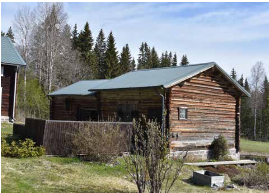
Ofärgad loge med nytt plåttak och ett gammalt ålderdomligt spröjsat fönster i gaveln. Kilen 1:34.