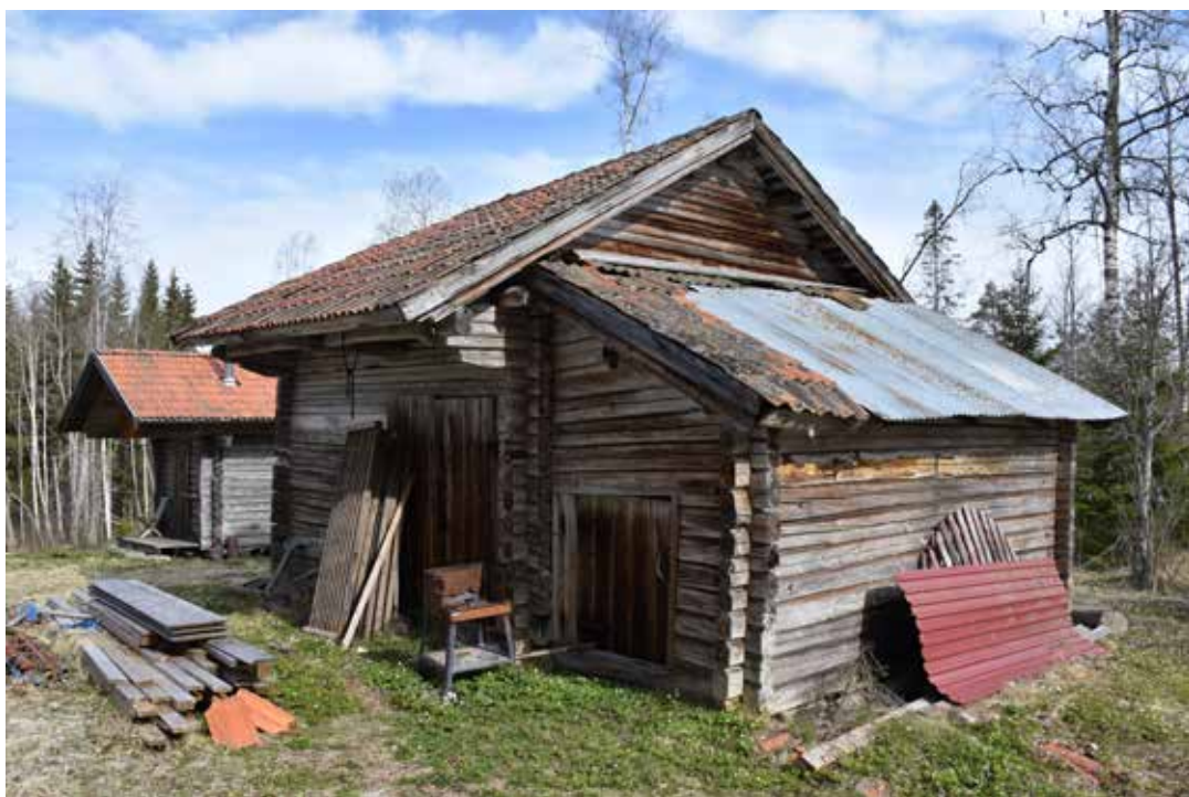
Ett stort antal av byggnaderna på fåbodarna är förhållandevis oförvanskade, men där senare takbeklädnader kan ha tillkommit. Laknäs 17:1.