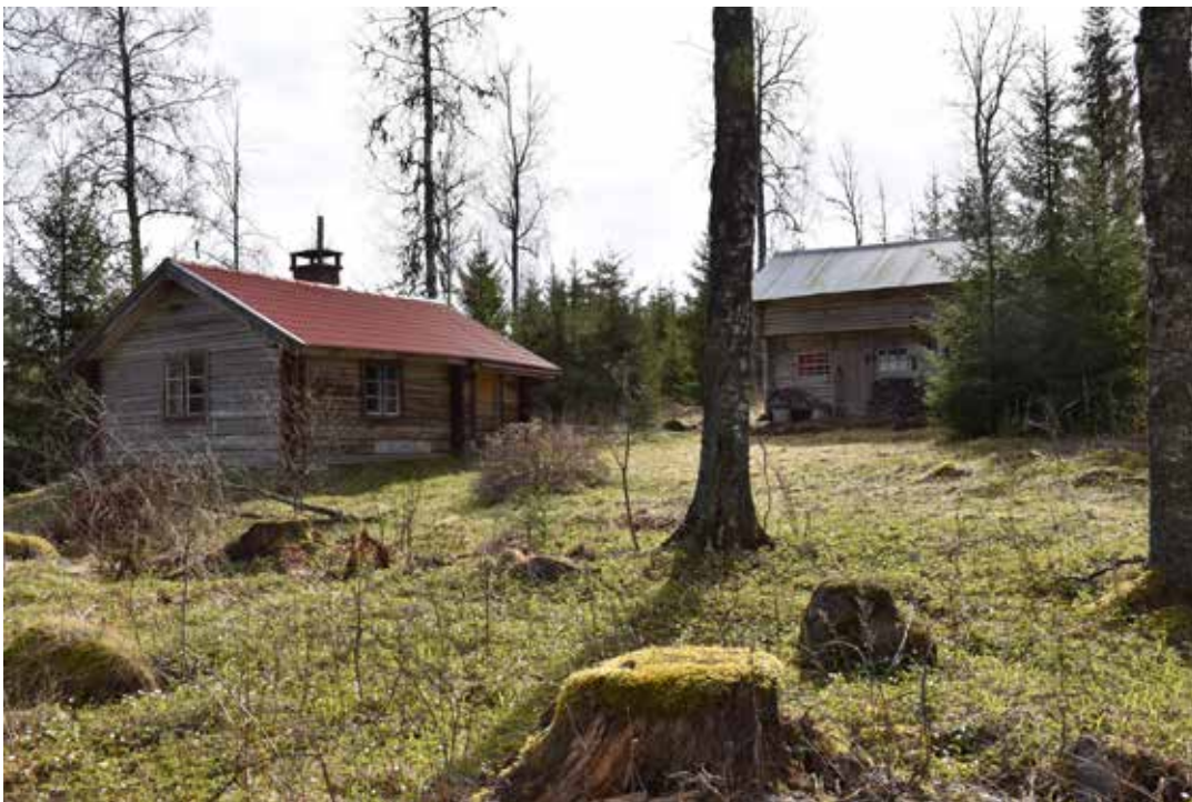
Inga fåbodgårdar i Brömsbodarna är helt fyrkantsbyggda men viss kringbyggdhet förekommer. Ovan ses exempel på fastigheter Lahnäs 17:1 och Tällberg 1:31.