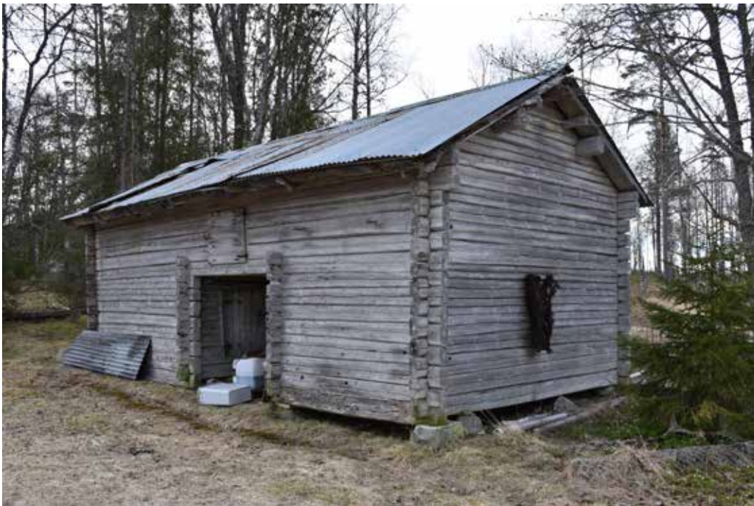
I Brömsbodarna är så gott som alla byggnader uppförda med naturligt grånat liggtimmer. Ovan ses ekonomibygnader på fastighet Laknäs 17:1.