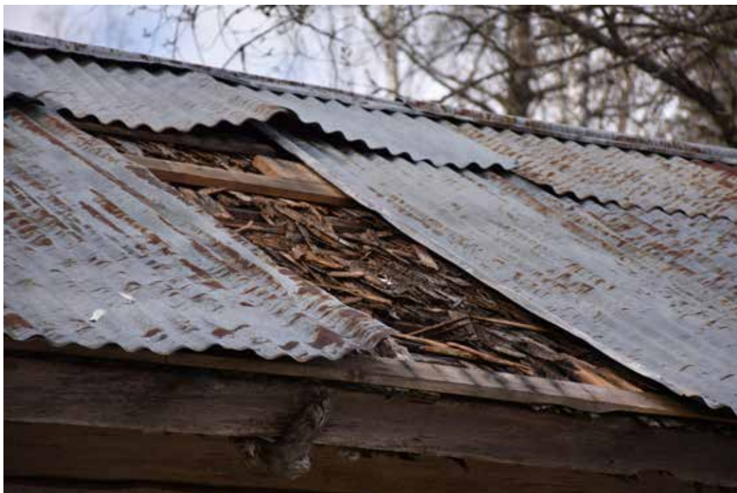
Flera tak är idag täckta med lertegel eller plåt. Under denna plåt skymtar resterna av ett äldre pärttak. Laknäs 17:1.